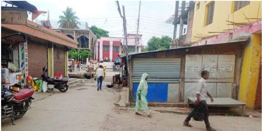
दैनिक समाचारदाता राजविराज, १८ साउन। अदालत र राजविराज नगरपालिकाको आदेश विपरित वर्षौदेखी सडकमै अतिक्रमण गरि पसल संचालन हुँदै आएको खुलासा भएको छ।

राजविराज ७ स्थित हाटबजार (हटिया) प्रवेश गर्ने एउटा मार्गको भित्र सडक खण्डमा विगत ९ वर्षदेखी अतिक्रमण गरि सडकमै पसल संचालन हुँदै आएको खुलासा भएको हो। सर्वोच्च अदालतको फैसला तथा नगरपालिकाको आदेश विपरित वर्षौ देखि सार्वजनिक जग्गा र सडक मै पसल संचालन गर्दै आएका एक जनाको हकमा नगरपालिकाले कडाई गर्न नसकेको स्थानीयले गुनासो गरेका छन्।